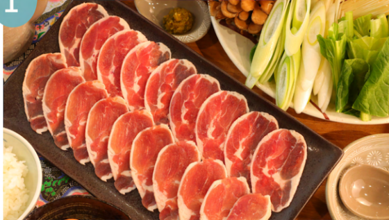
星生名物カモ鍋 1人前 3300円