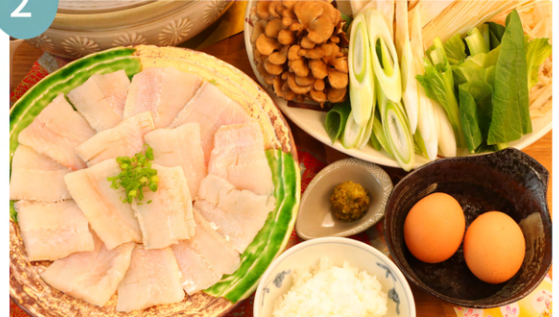
大分県産 鰻鍋 1人前 3900円