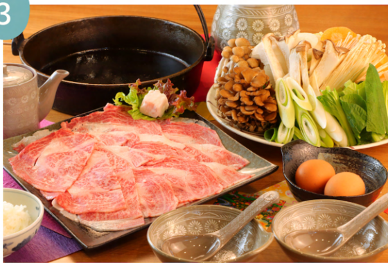
おおいた和牛のすき焼き 1人前 5500円