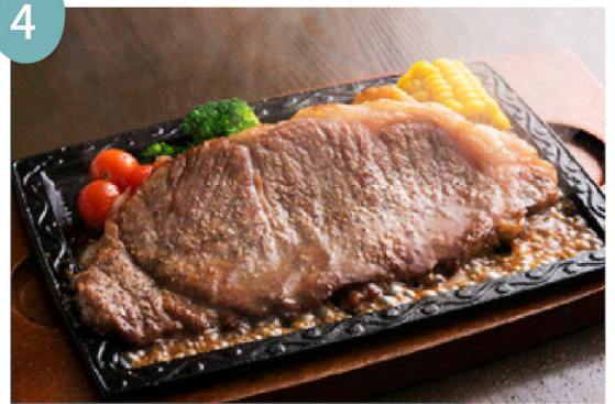
おおいた和牛ステーキ 1人前 5500円