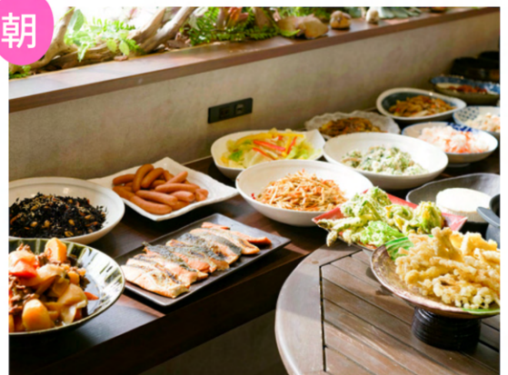
おばんざい朝食 (ビュッフェ式) 1人様 1500円